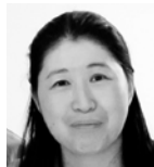
▶ Akiko Takahashi Clinic of Gastroenterology Saku Central Hospital Nagano/Japan