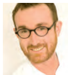
▶ Martin Mangold Zentrum für Innere Medizin Klinikum Garmisch-Partenkirchen GmbH Garmisch-Partenkirchen