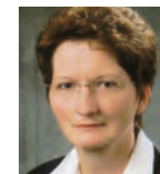
▶ Gudrun Rettig Klinik für Innere Medizin Sana Klinikum Lichtenberg Berlin