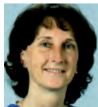
▶ Sabine Blümel Klinik für Interdisziplinäre Endoskopie Klinikum Großhadern München